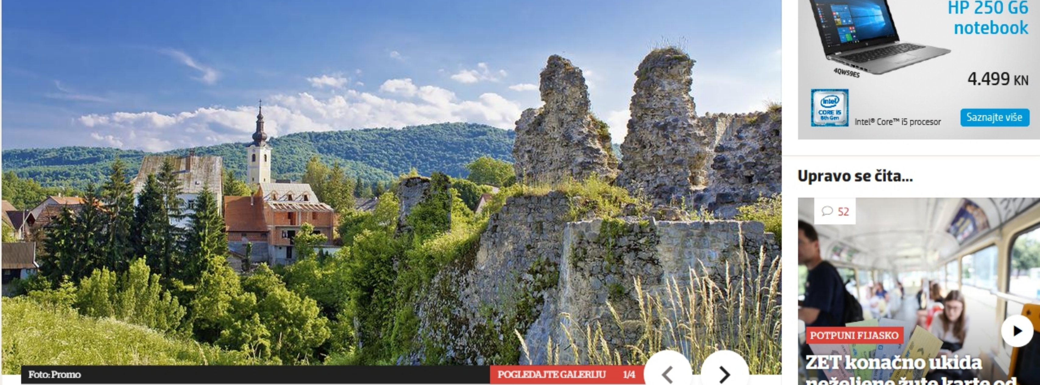
POGLEDAJTE GALERIJU 1/4

Split, Zadar i Dubrovnik među 20 najnagrađivanijih gradova svijeta već drugu godinu za redom